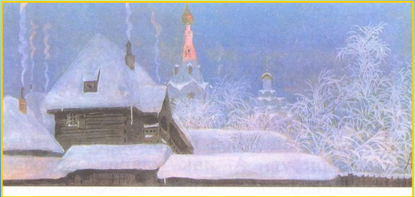
А. Рябушкин «Зимнее утро»