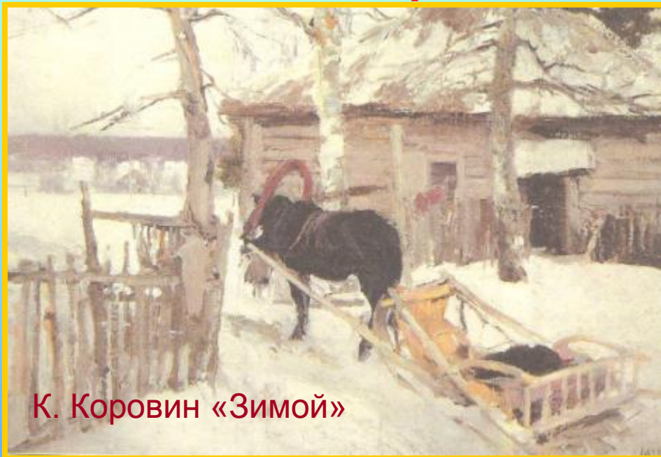
К. Коровин «Зимой»